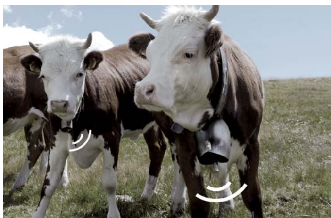
© Marco Monticone & Alain Bellet

DI 26.6. 18:00 MA 28.6. 18:00 ME 29.6. 18:00 JE 30.6. 18:00 VE 1.7. 18:00 SA 2.7. 18:00